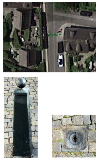
Fig. 4 Eksempel på flytbar stele med lås.