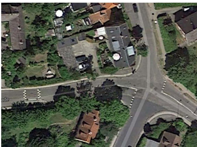
Fig. 1 Nuværende vejforløb i Brøndgade, Havnevej, Sct. Ibs vej krydset

Brøndgade og ud i Havnevej-krydset. Indkørslen må gerne flankeres af et par mindre træer, hvilket synsmæssigt vil markere områdets afgrænsning i begge retninger.