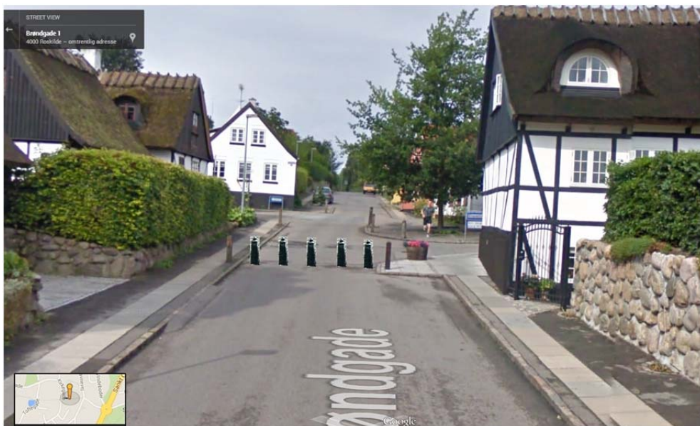
Fig. 3 Forslag til placering af permanent spærring med flytbare steler ved Kirkegade.