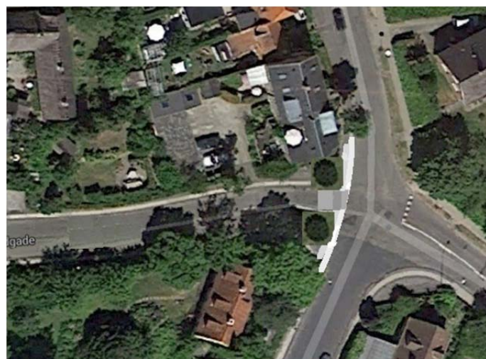
Fig. 2 Foreslået indkørsel til Brøndgade fra Havnevej, Sct. Ibs vej