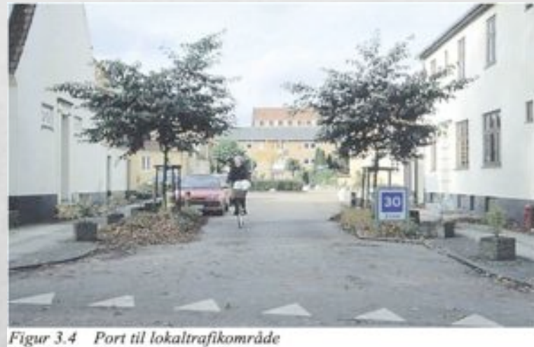
Figur 3.4 Port til lokaltrafikområde