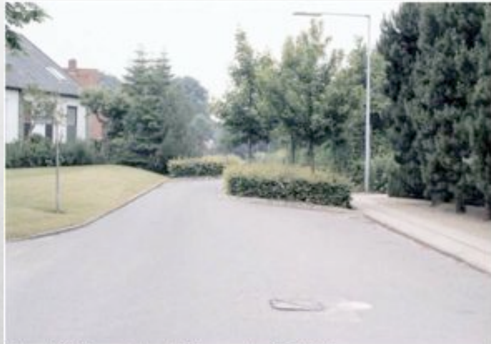
Figur 4.27 Forsætning af indsnævring fra 2 til 1 spor