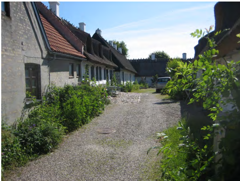
Vrågården - Et konkret eksempel på hvorledes det er lykkedes en gruppe beboere, at bevare et originalt gårdmiljø fra 1794