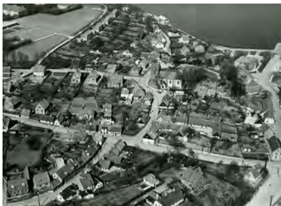
Luftfoto, ca. 1935

Da vandstanden i fjorden var langt højere end i dag, har Sct. Jørgensbjerg ligget som en halvø, en bastion ud i fjorden. Hvad området har heddet vides ikke, men kirken var meget naturligt indviet til Sct. Clemens, de søfarendes helgen.