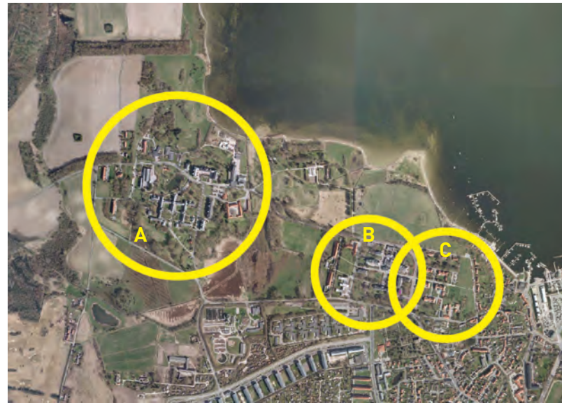
A: Vestlig del af Sankt Hans B: Østlig del af Sankt Hans C: Region Sjællands hospital, Fjorden